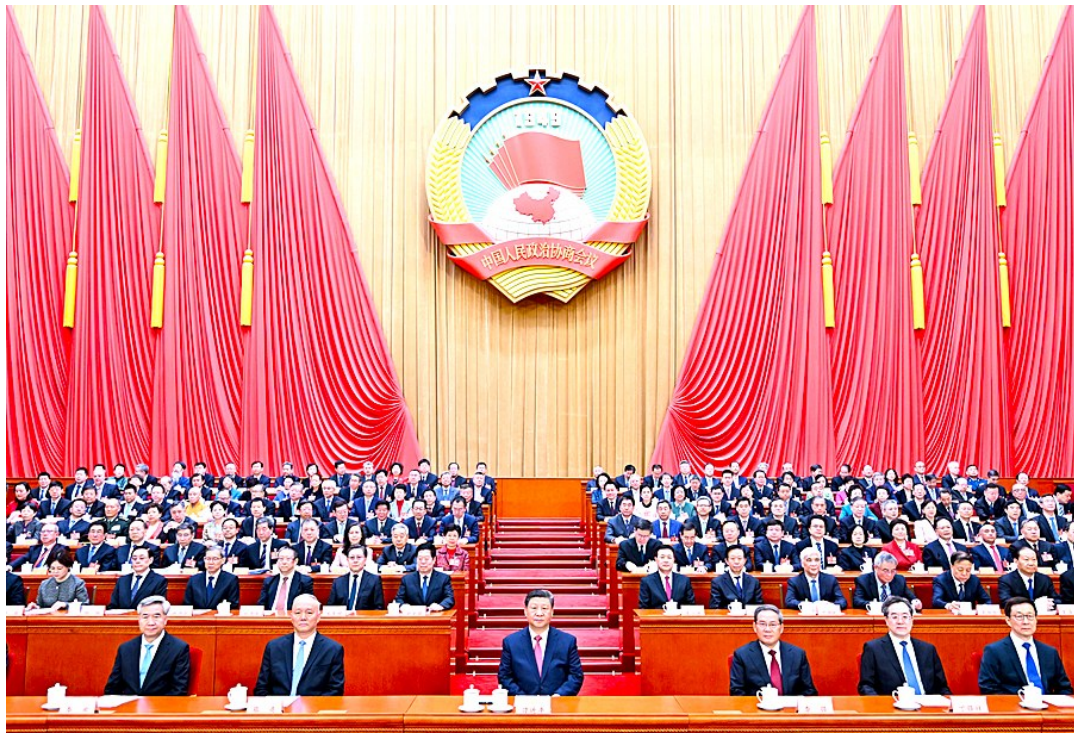
3月10日上午,中国人民政治协商会议第十四届全国委员会第三次会议在北京人民大会堂闭幕。这是习近平、李强、蔡奇、丁薛祥、李希、韩正在主席台就座。