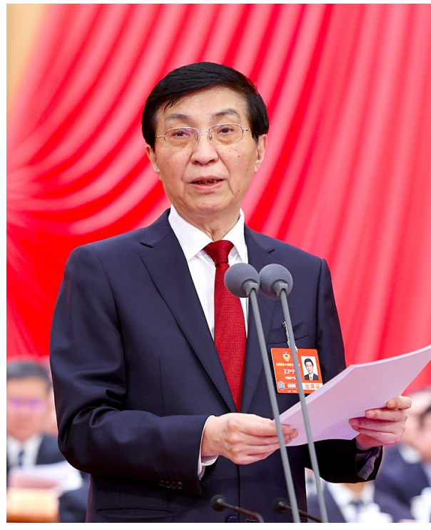
3月10日上午,中国人民政治协商会议第十四届全国委员会第三次会议在北京人民大会堂闭幕。全国政协主席王沪宁主持闭幕会并讲话。