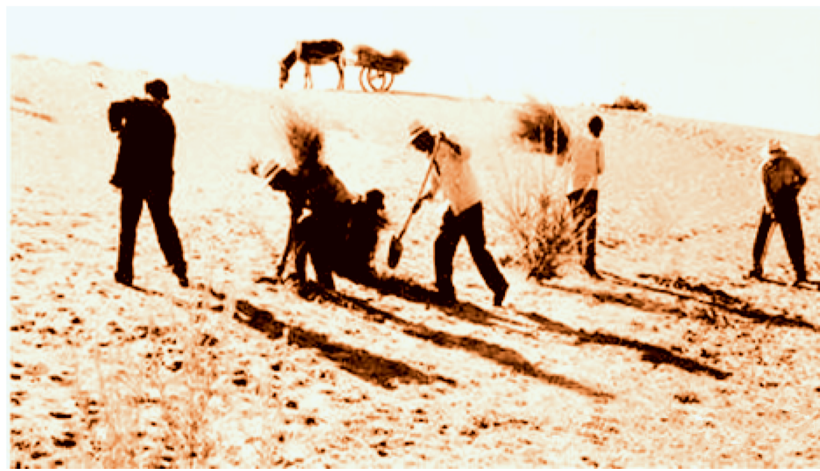
六老汉们治沙造林

如今,八步沙林场兵强马壮,一场七站25名职工,不仅管护着八步沙、黑岗沙、七道沟、十道沟、十二道