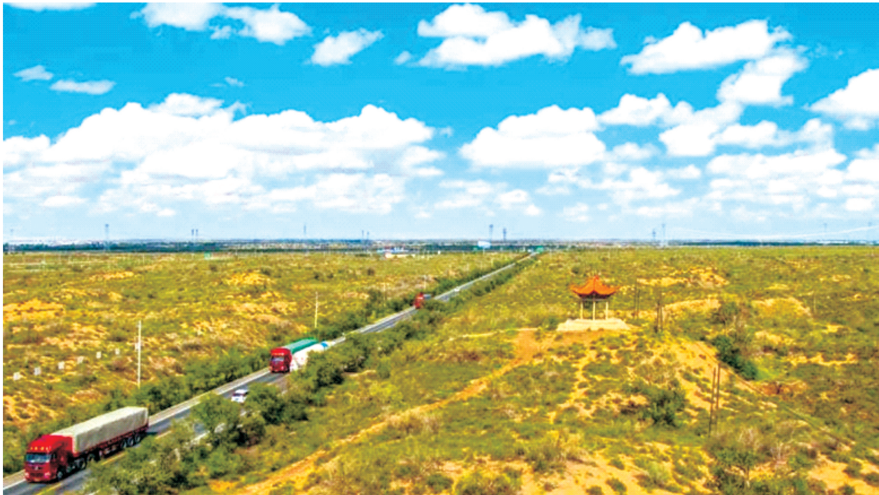
八步沙林场治理后的308省道及甘武铁路