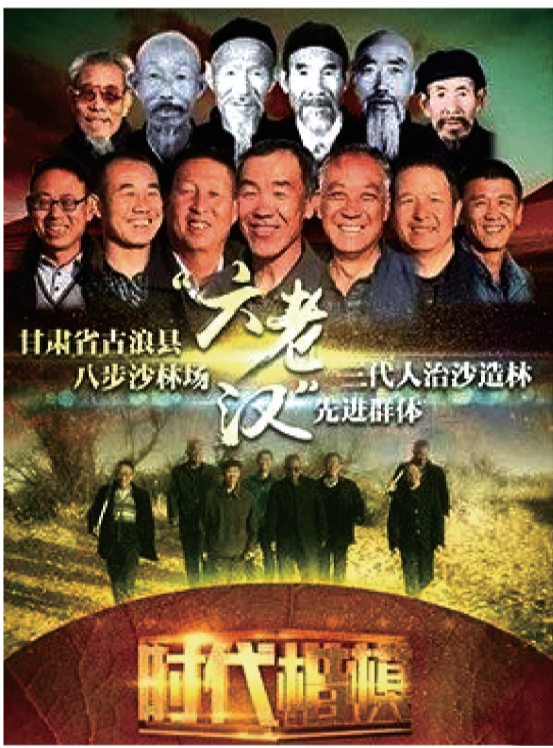
八步沙林场治沙人荣获中宣部“时代楷模”荣誉称号