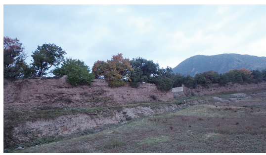
中堡东城墙及城门

中堡村堡子：中堡村位于岷县城南叠河（别称西河）与藏河交汇的三角地带，距离县城5公里左右。据