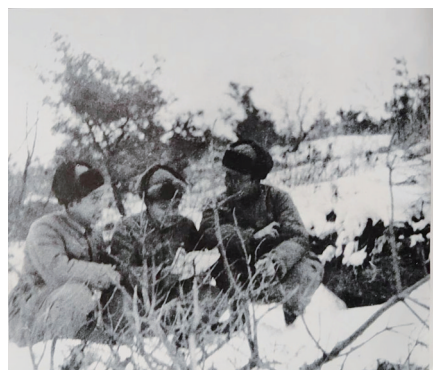
1952年冬，魏巍（右一）在朝鲜战地与志愿军在一起。

历的作家，他以真挚的感情和强烈的社会责任感，以其雄厚的生活基础、文学功底与作家的敏锐感，抓住了这个伟大的主题，写出了中国人民志愿军在抗美援朝战争中所表现出来的英雄气概及高尚的情怀，说出了人民要说的话，喊出了人民的心声，拨动了人民的心弦，所以文章一发表立即引起广大读者内心的共鸣，产生了强烈的反响和的巨大力量。从此，“最可爱的人”成为中国人民志愿军和人民解放军的代名词。