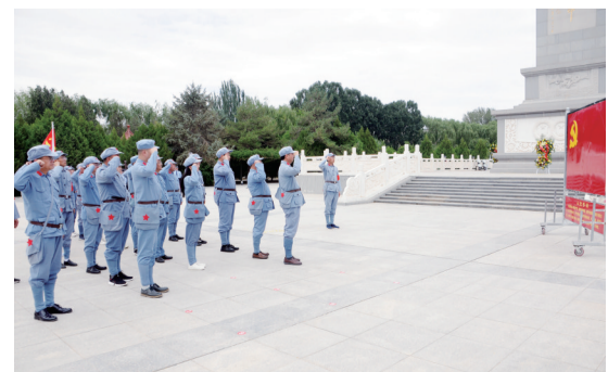
党员干部瞻仰中国工农红军西路军纪念馆。

展示建设成就。 结合庆祝中国共产党成立100周年，迎接上级领导检查、“5·12”防灾减灾，省人防办协调制作专题汇报片，形象生动地反映全省人防建设发展成就。指导各重点人防城市制作高清专题宣传片，在各地集中展播。在“9·18”事变90周年之际，编辑出版庆祝建党100周年大型纪念画册——《铸就千里陇原护民之盾》，以图文并茂的形式，从十个不同方面，真实反映了全省人防建设的辉煌过程和丰硕成果，全方位、全领域回顾人民防空发展历程。在“12·4”国家宪法日组织法治宣传活动，集中宣传宪法、国防法、人防法和党的十九