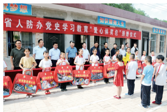
开展巩固脱贫攻坚成果同乡村振兴有机衔接暨党史学习教育为民办实事活动。

精心筹划指导。 办党组确立了“政治引领、巩固规范、转型升级、高质量发展”的工作思路，坚持以习近平新时代中国特色社会主义思想为指导，深入贯彻总体国家安全观，全面贯彻党的十九大和十九届历次全会精神，认真落实习近平总书记对甘肃重要讲话和指示精神，全面落实习近平总书记关于人民防空重要指示精神，牢记人防应急应战职能使命，深化拓展人防军事斗争准备，聚焦练兵备战、转型升级、建设管理，着力走出一条高质量发展新路子，确保“十四五”实现良好开局。