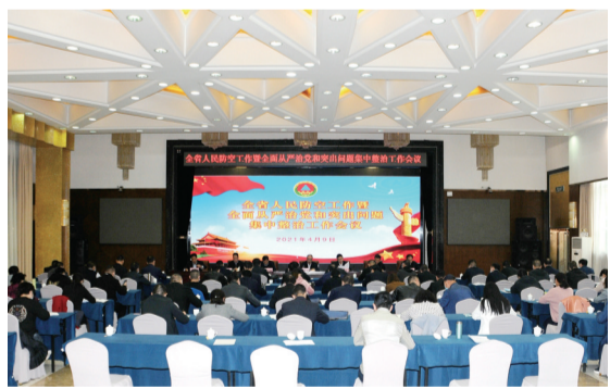
全省人民防空工作暨全面从严治党和突出问题集中整治工作会议在兰州召开。

强化政治意识。 办党组围绕立足新发展阶段、贯彻新发展理念、构建新发展格局、推动高质量发展，坚持以习近平新时代中国特色社会主义思想武装头脑、指导实践、推动工作，学习运用百年奋斗伟大历史经验，深入开展党史学习教育。年内共召开党组理论学习中心组学习会议41次，研讨交流8次，专题读书班2次，开展党史专题学习21次，编发党史学习教育简报32期。党员干部政治上更加成熟，理论上更加清醒，思想上更加坚定，忠诚拥护“两个确立”、坚决做到“两个维护”更加自觉，坚决同以习近平同志为核心的党中央保持高度一致的政治定力更加稳固。