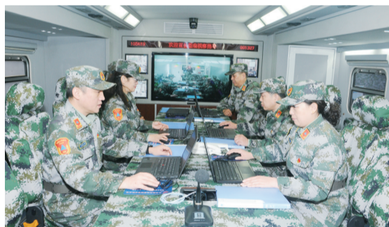
开展应急指挥演练活动。

项目建设质量监管不断加强。 针对项目审批不规范、指挥通信有短板、自建项目欠账多的问题，省人防办下大力抓好人防项目建设，提出了“三个严格，七个禁止”要求，确保审批程序规范，把有限的资金用在急建项目上，推动基本指挥所和省级疏散基地项目建设落地见效。从2020年8月份开始到2021年8月底前，部署开展了为期一年的工程质量建设年活动，明确了8个方面22项具体内容，对所有人防工程开展拉网式排查，摸清质量底数。全面展开对早期工程的评估工作，能使用的加固改造，不能使用的报废拆除，确保“保命工程”能够保命。加强全省人防工程监理业务培训，建立人防工程监管信息数据库，并对部分在建人防工程进行了质量监督检查，对部分市州以及所辖县区进行了人防行政执法专项督查。