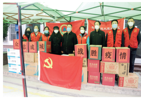
向大雁滩社区捐赠防疫物资。

疫情防控乡村振兴持续尽责。 针对新冠肺炎疫情防控严峻形势，省人防办认真贯彻落实党中央、国务院和省委省政府指示，深入学习领会上级连续下发的有关通知精神，召开党组会议和处以上领导干部会议，研究部署疫情防控工作，全力以赴抓好落实。始终绷紧疫情防控这根弦，克服麻痹思想、侥幸心理、松劲心态，坚持底线思维，始终保持警惕，从严从紧抓实抓好疫情防控工作。按照省纪委监委《关于进一步严明疫情防控纪律的通知》和省疾控中心“疫情防控提醒”，及时下发通知，明确具体事宜。要求全体党员干部严格遵守各项疫情防控纪律规定，人人履行防控责任，在自己工作岗位上履职尽责。党员干部特别是领导干部坚决扛起疫情防控政治责任，与所在社区“共建共防”，开展志愿服务活动，充分发挥示范引领作用，发挥党支部战斗堡垒和党员先锋模范作用，以疫情防控的实际行动、优异成绩，向党和人民交出合格满意的答卷。全面启动乡村振兴帮扶工作，成立巩固脱贫攻坚成果同乡村振兴有效衔接工作领导小组，在宁县召开了省直帮扶单位和宁县有关部门参加的推进会议，通过3个帮扶项目进一步改善基础设施条件，并向帮扶村小学捐赠了价值1万元的爱心体育用品。按照省委省政府安排，协调平凉市召开住宅小区历史遗留推进工作会议，安排工作人员到项目现场进行摸底；向各市州下发解决城镇住宅历史遗留问题的通知，并以视频的形式召开了培训会议，全省人防系统共化解479个项目135467套住宅历史遗留“登记难”问题，化解率达到85.7%。